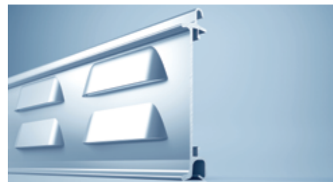
Lüftungsprofil für Links- und Rechtsroller