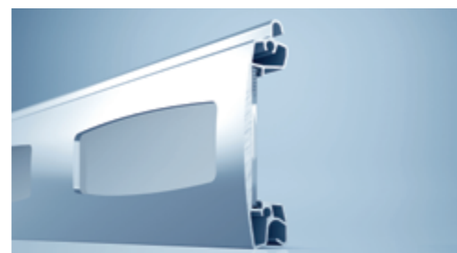
Sichtprofil mit Makrolon, auch als offenes Gitterprofil erhältlich