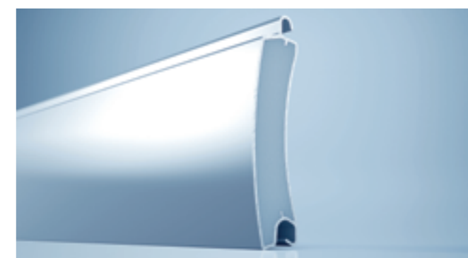
heroal RD 75 E – stranggepresster Rolltorstab