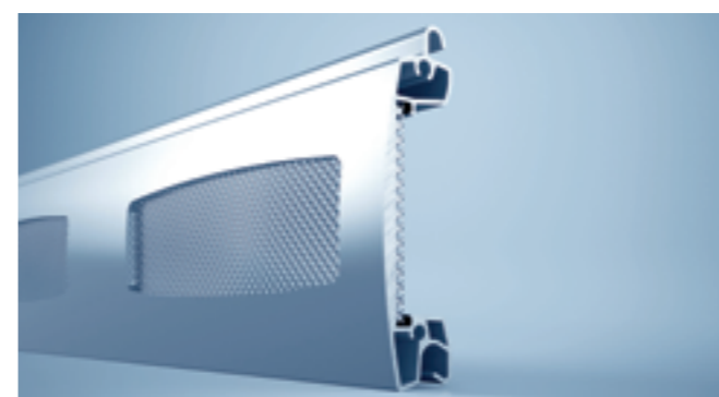
Gitterprofil mit Streckmetall als Lüftungsprofil

Für eine stärkere Belüftung oder höheren Lichteinfall kann der Rolltorpanzer durch Sicht-, Gitter- und Lüftungsprofile ergänzt werden - gestalterisch lassen sich dabei außerdem farbliche Akzente setzen.